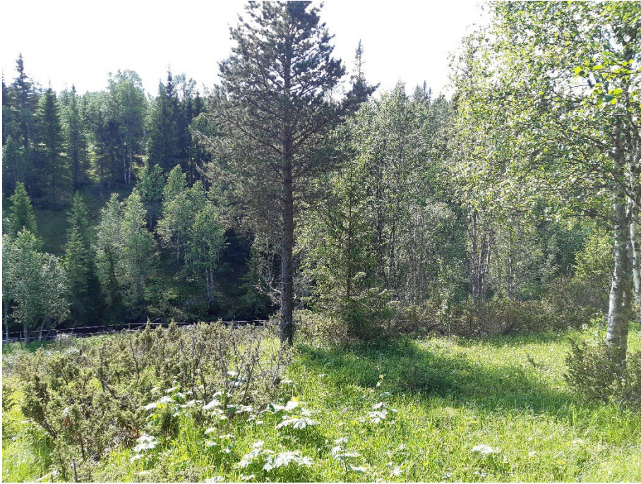
Fotopunkt 5 före åtgärd.