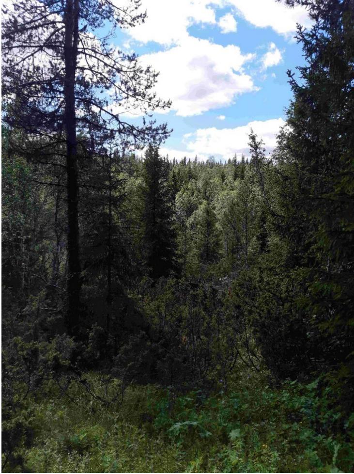
Fotopunkt 3 före åtgärd.