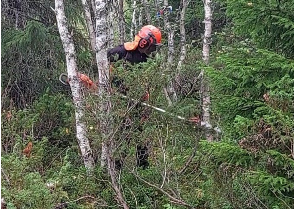
Röjning av björk.