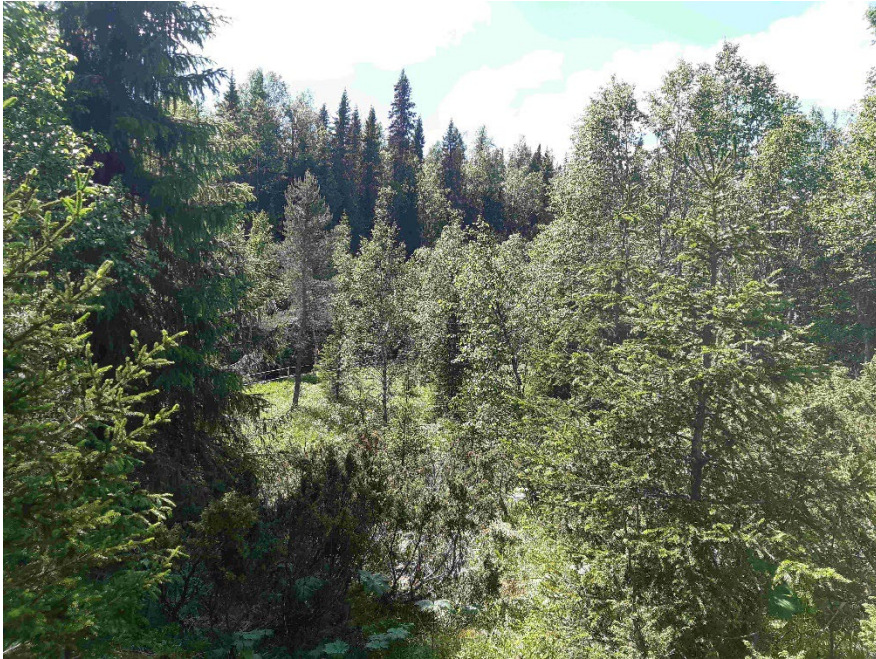
Fotopunkt 1 före åtgärd.