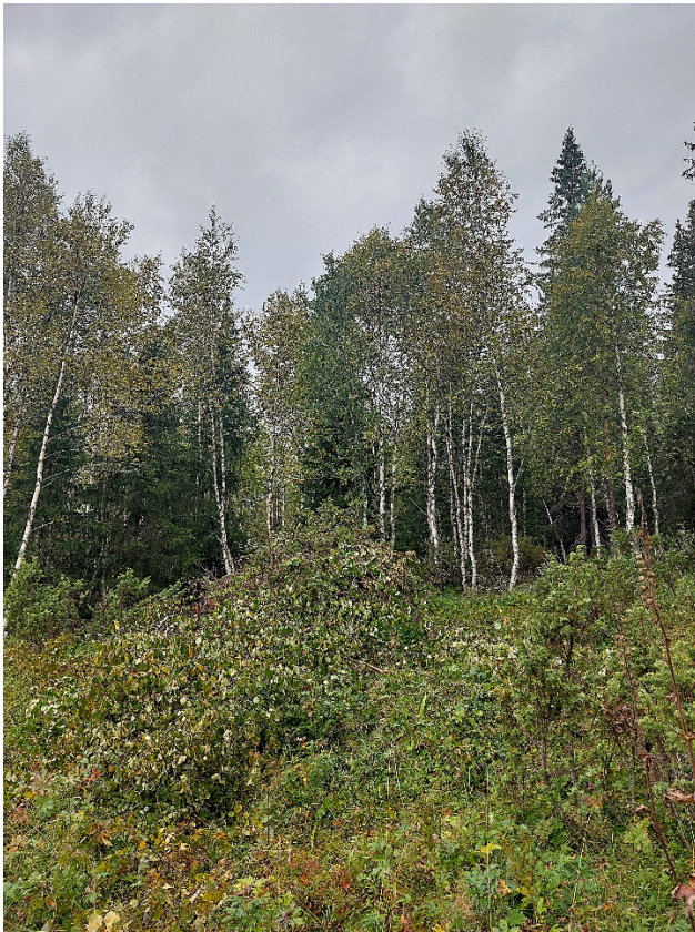
Hög med enebuskar och björkkvist efter röjning.