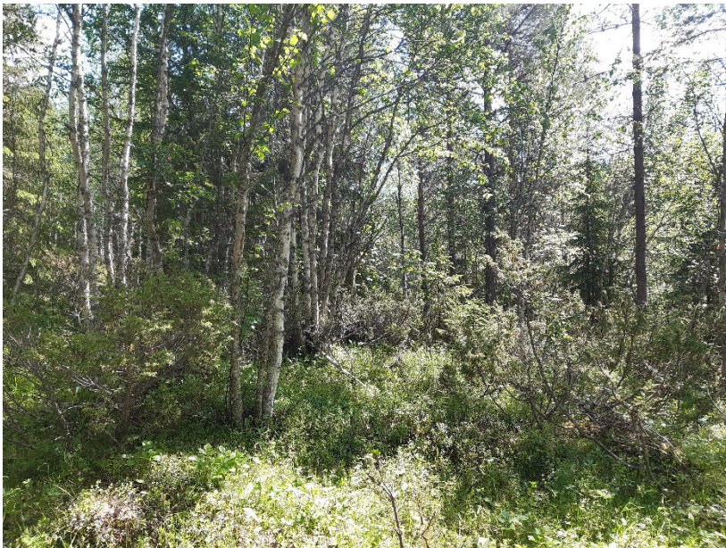
Fotopunkt 4 före åtgärd.