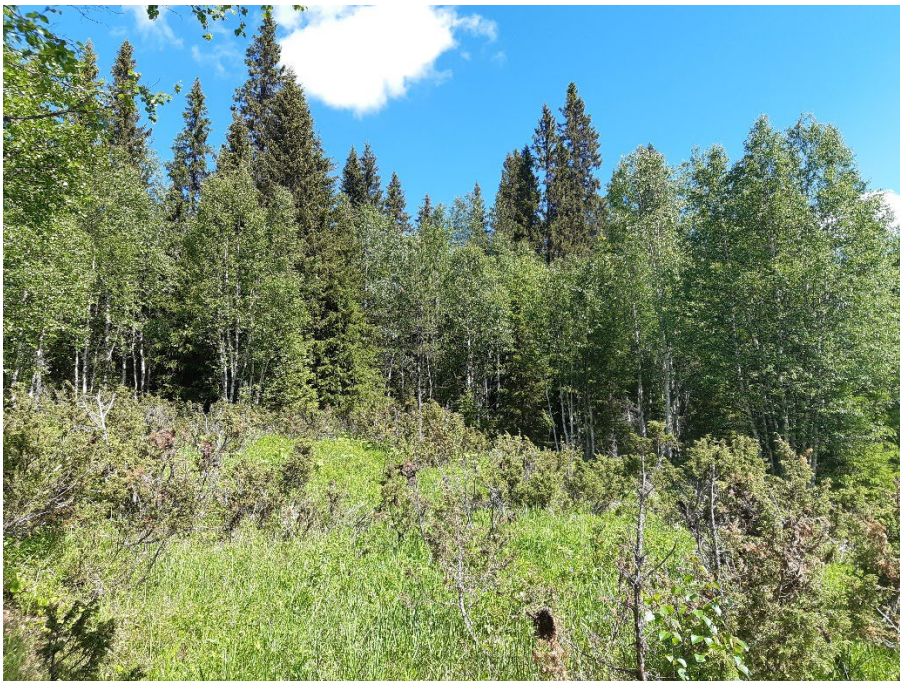
Fotopunkt 6 före åtgärd.