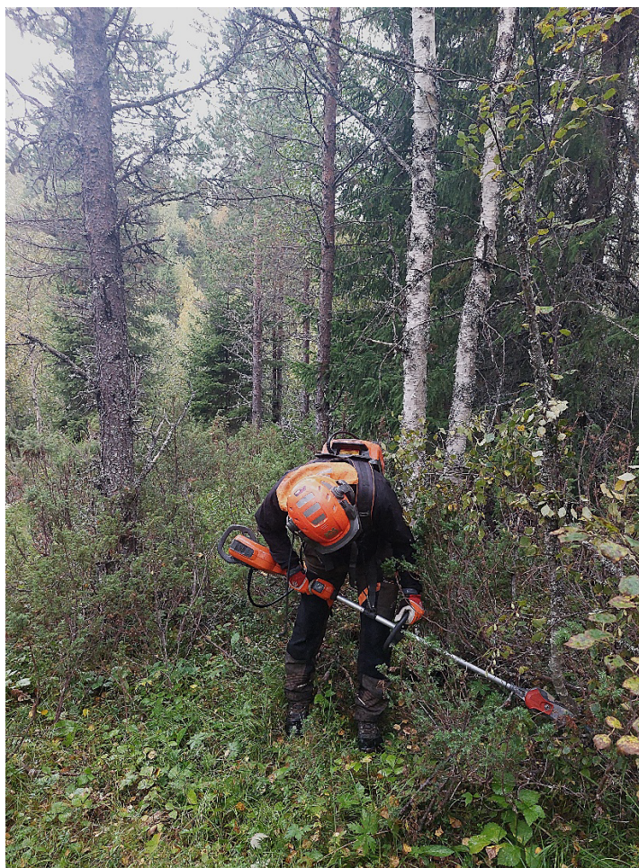
Röjning av enebuskar med eldriven röjsåg.

Sommaren och hösten 2024 utfördes manuell röjning i de södra delarna av Natura 2000-området Sundmyren Åflo (SE0720470). Natura 2000-området och omgivande markområden ingår sedan den 11 november 2024 i naturreservatet Järnbäcken (dnr: 511-7339-2024). Projektområdet utgörs i dagsläget av utvecklingsmark och de åtgärder som genomförs syftar till att området på sikt ska kunna klassas som 6210 Kalkgräsmark .