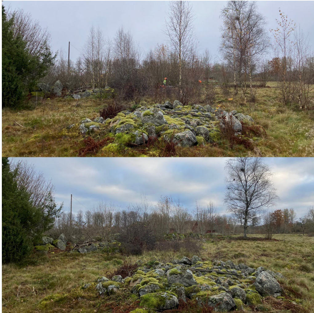
Röjningar har utförts i området. På bilden ovan är markerna igenväxta med björksly. På den nedre bilden har röjning utförts och blommande buskar och bryn sparats.