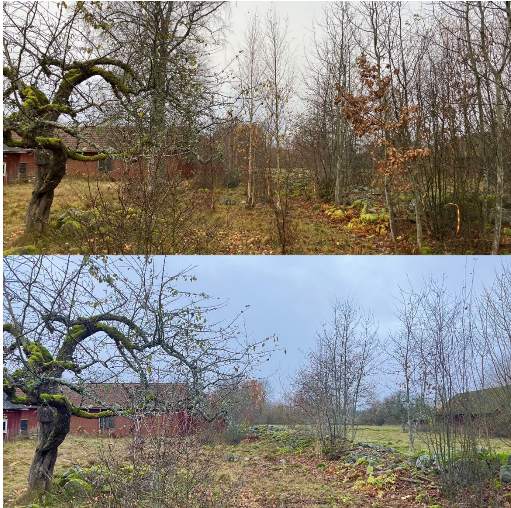
Utglesning av blommande bryn och friställning av blommande små buskar har genomförts. Det gynnar vilda pollinatörer i området.