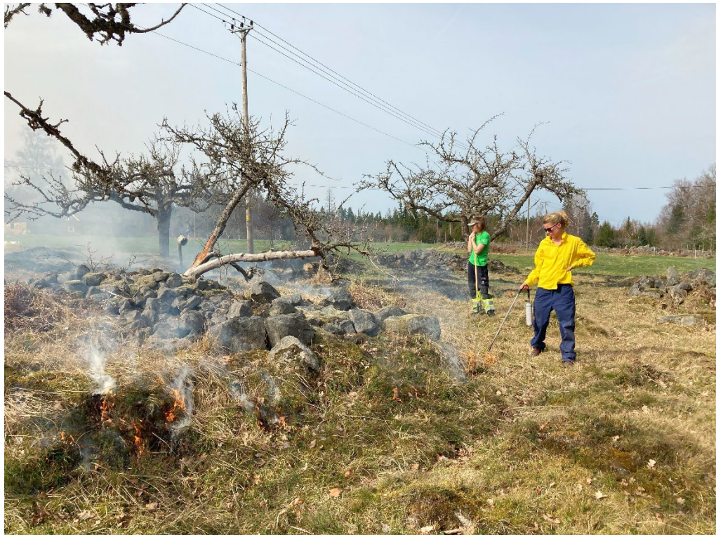
Gräsbränningen påbörjas. Att restaurera gräsmark med bränning är ett bra sätt att få bort mossor och gammal förna som i sin tur gynnar blomrikedomen.