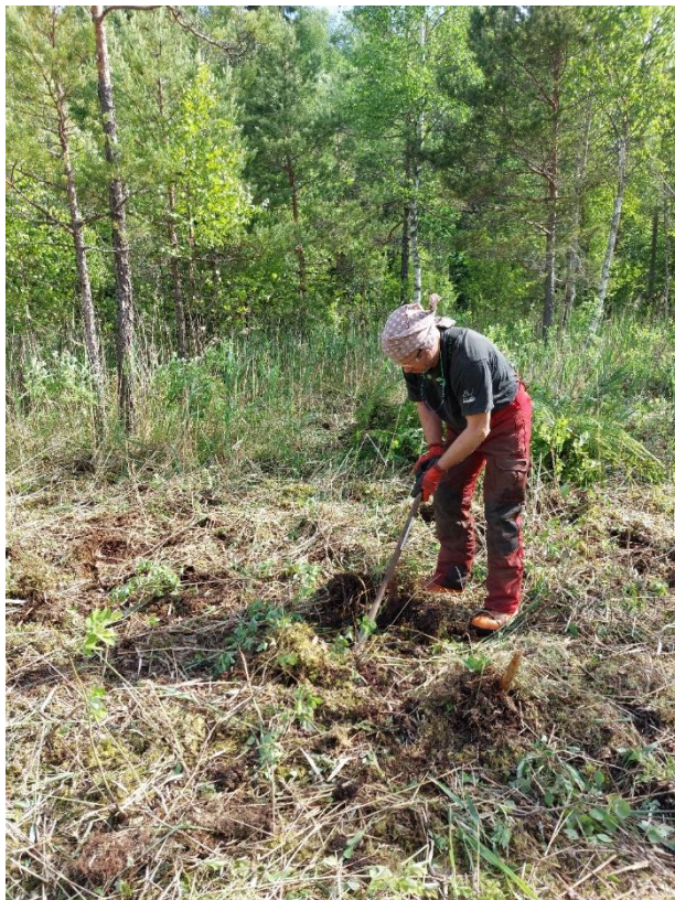
Bild 2. En del av de mindre träden och buskar togs upp med rötter under våren-sommaren 2023.