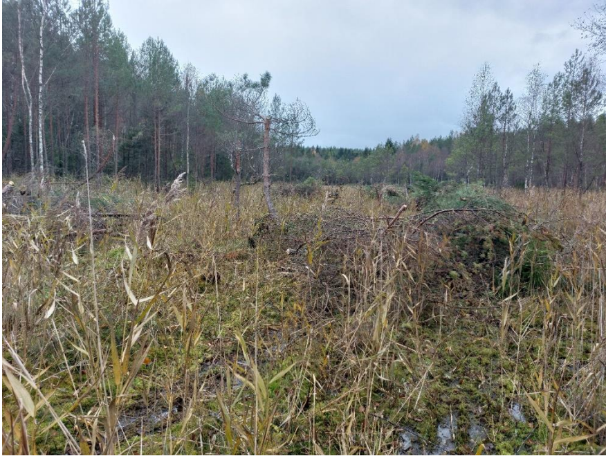
Bild 9. Bilden är tagen efter andra gallringen. En öppen yta som binder samman de tidigare restaurerade kärrområdena har skapats. Bilden tagen mot väst. (ObjektID saknas).