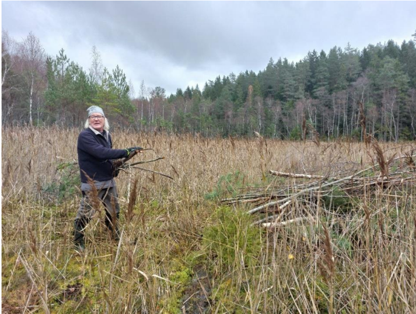
Bild 3. Arbetet med gallring och ihopsamling av material under hösten 2023. Material har samlats i högar som nu väntar på att brännas upp under våren 2024. (ObjektID saknas).