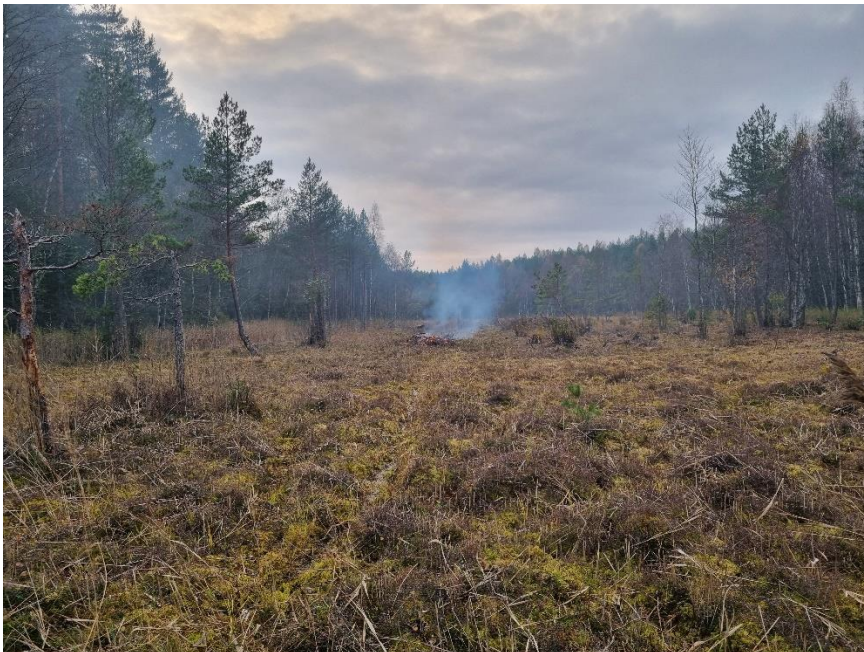
Bild 10. En del av utglesningsmaterialet har bränts under hösten 2024.