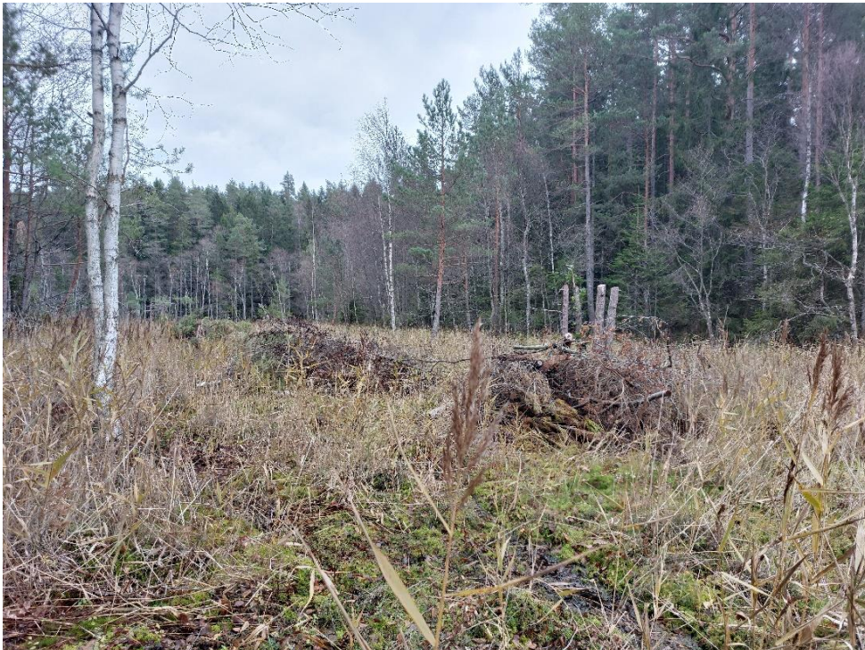
Bild 8. Bilden är tagen efter andra gallringen hösten 2023. En öppen yta som binder samman de tidigare restaurerade kärrområdena har skapats. Bilden tagen mot öst. (ObjektID saknas).