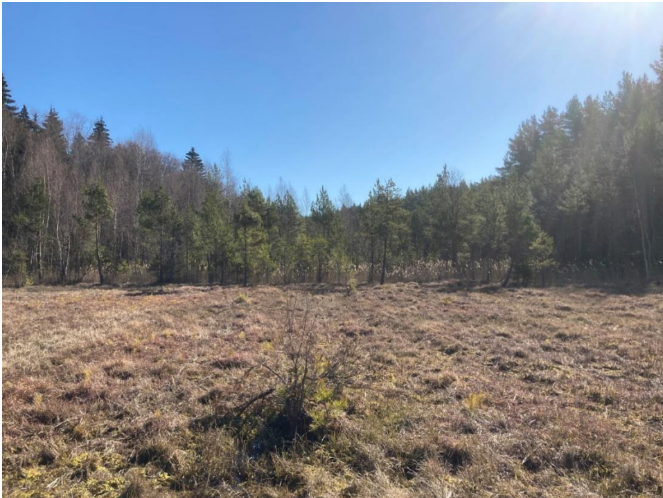
Bild 5. Bilden är tagen före åtgärden. Den visar igenväxning med ung tall och björk och hög vass som skuggar området mer ljuskrävande flora. Det tidigare restaurerade kärrområdet i förgrunden. (ObjektID 394).