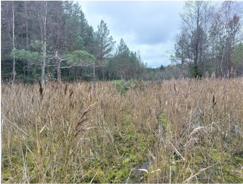
Bild 11. Bilden är tagen före slåtter. Vassen växer hög. (ObjektID saknas).