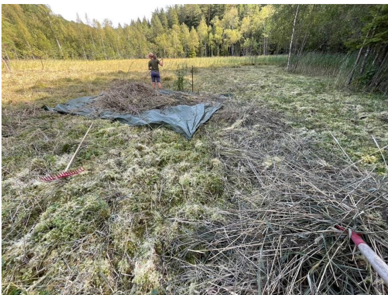
Bild 12. Restaureringsslåtter pågår. sommaren 2024 (ObjektID saknas).