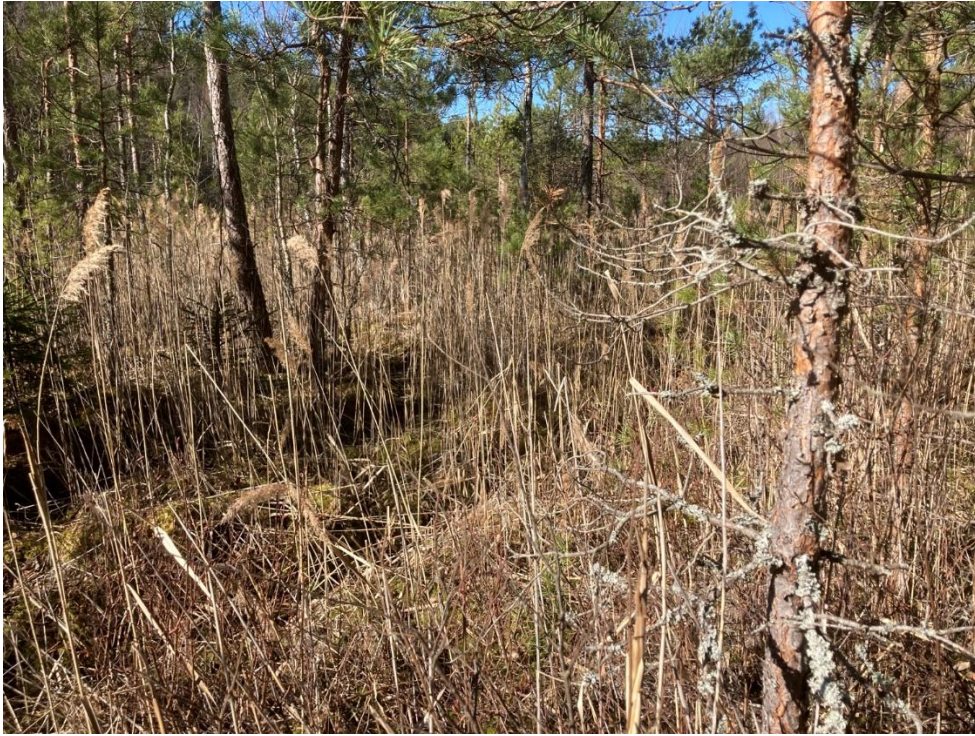
Bild 7. Bilden är tagen före åtgärden. Den visar igenväxning med ung tall och hög vass.