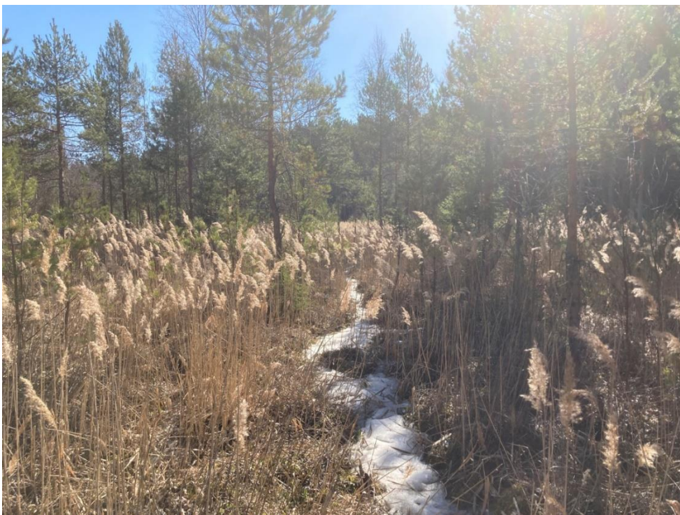
Bild 6. Bilden är tagen före åtgärden. Den visar igenväxning med ung tall och björk och hög vass. (ObjektID 403).