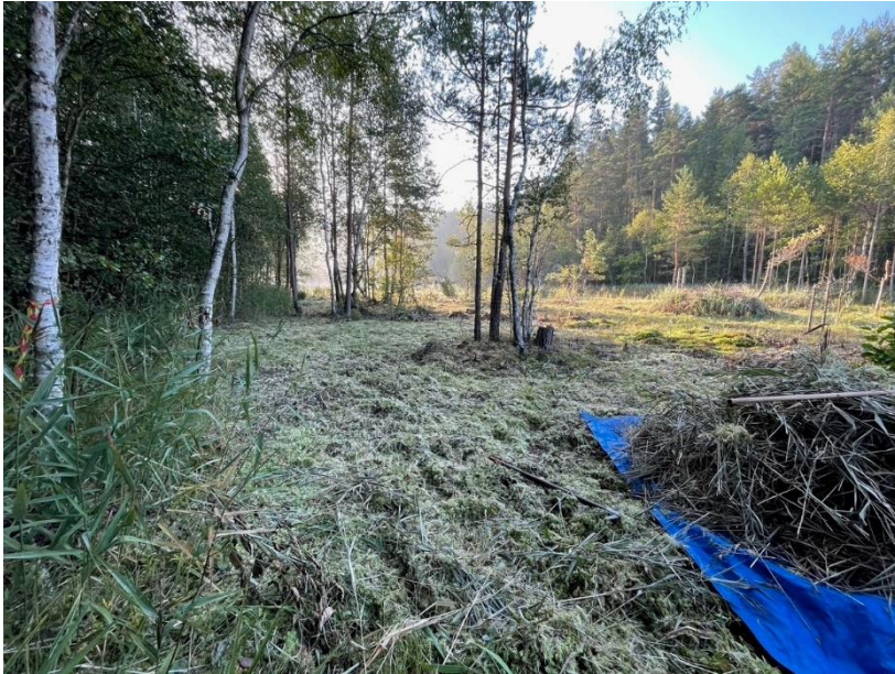
Bild 13. Restaureringsslåtter i området 2024. Foto: Stefan Hahre sommaren 2024 (ObjektID saknas).