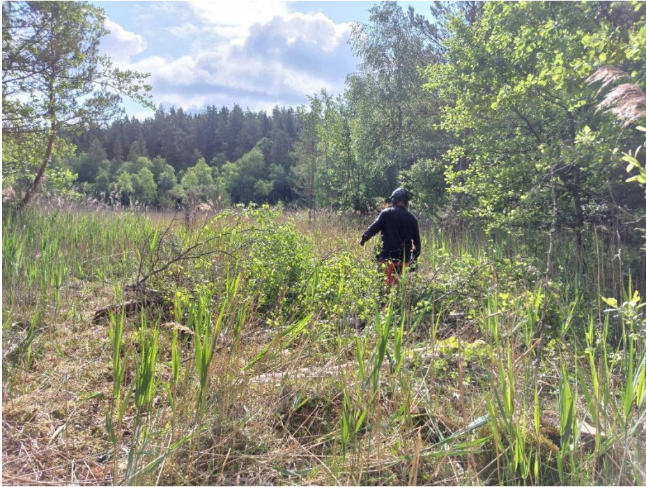
Bild 1. Arbetet med gallring och ihopsamling av material har pågått under våren-sommaren 2023. (ObjektID saknas).