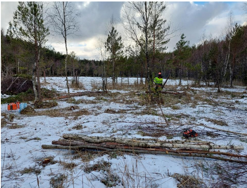
Bild 4. Arbetet med gallring under vinter 2024. De flesta större träden fälldes, stockarna transporterades med hjälp av fyrhjuling till närliggande skog och faunadepåer skapades.